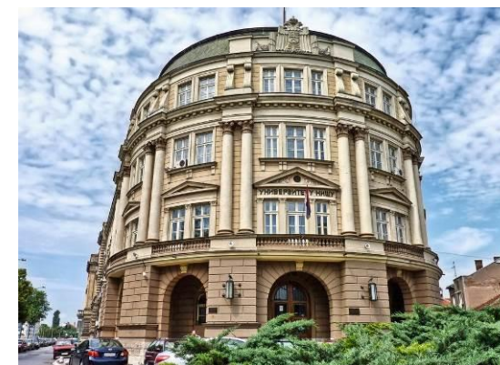
Универзитет у Нишу

УНИВЕРЗИТЕТ У НИШУ ГРАЂЕВИНСКО-АРХИТЕКТОНСКИ ФАКУЛТЕТ